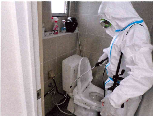
各トイレ 噴霧消毒