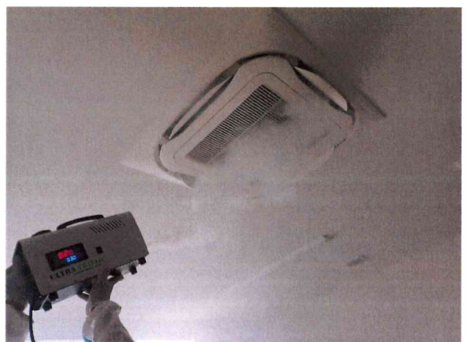
ミライ1, 2 ウルトラシールド煙霧施工