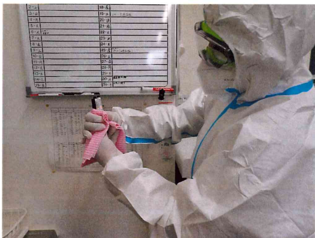
ミライ1, 2 清拭消毒