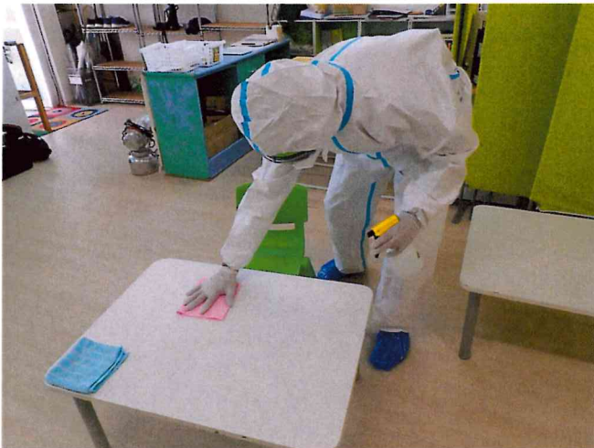
ミライ1, 2 清拭消毒