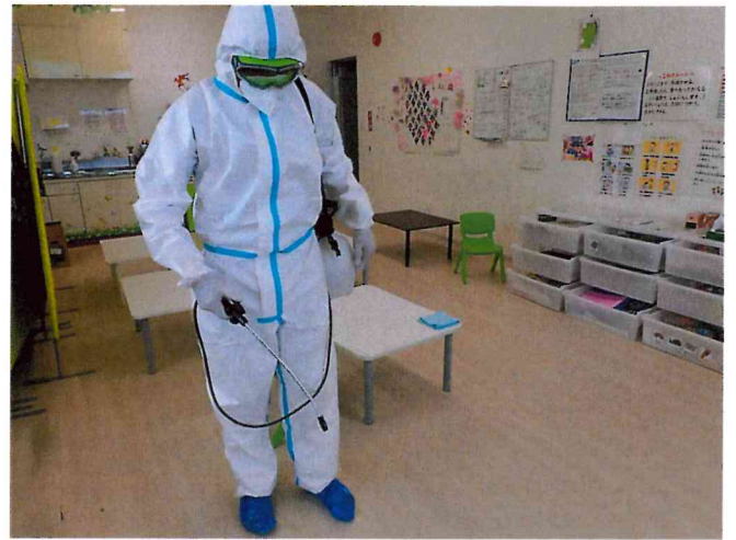
ミライ1, 2 噴霧消毒