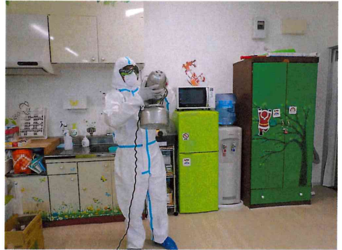
ミライ1, 2 ULV空間除菌