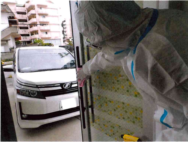
ミライ1, 2 清拭消毒