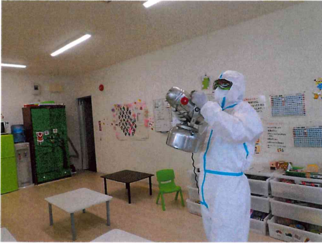
ミライ1, 2 ULV空間除菌