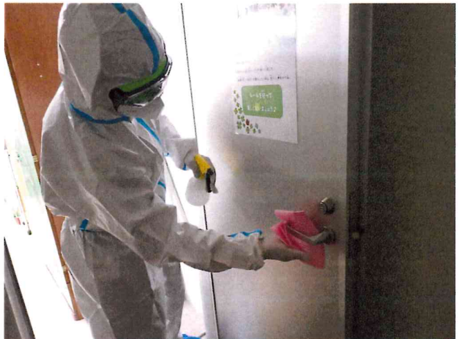
ミライ1, 2 清拭消毒