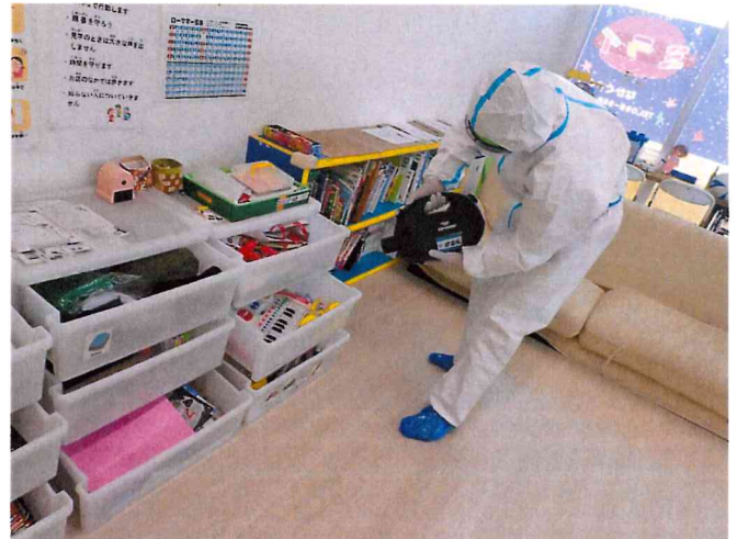
ミライ1, 2 ULV空間除菌