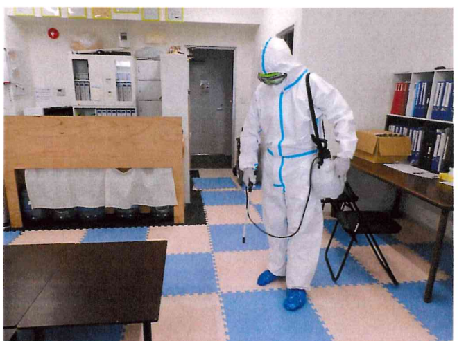
ミライ1, 2 噴霧消毒