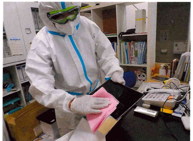
ミライ1, 2 清拭消毒