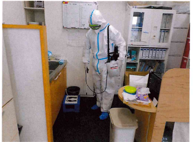
ミライ1, 2 噴霧消毒