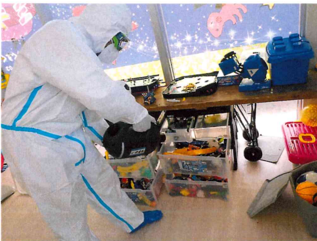
ミライ1, 2 ULV空間除菌