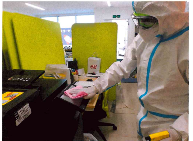
ミライ1, 2 清拭消毒