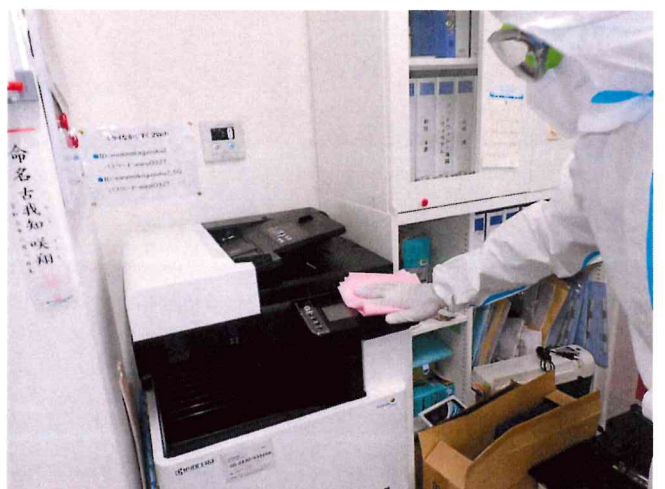
ミライ1, 2 清拭消毒