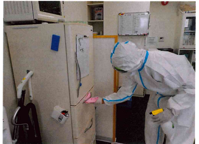
ミライ1, 2 清拭消毒