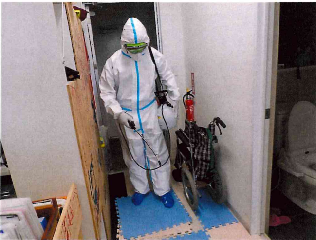
ミライ1, 2 噴霧消毒