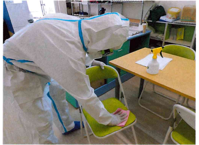
ミライ1, 2 清拭消毒