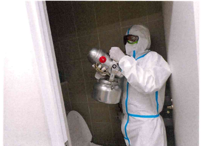
各トイレ ULV空間除菌