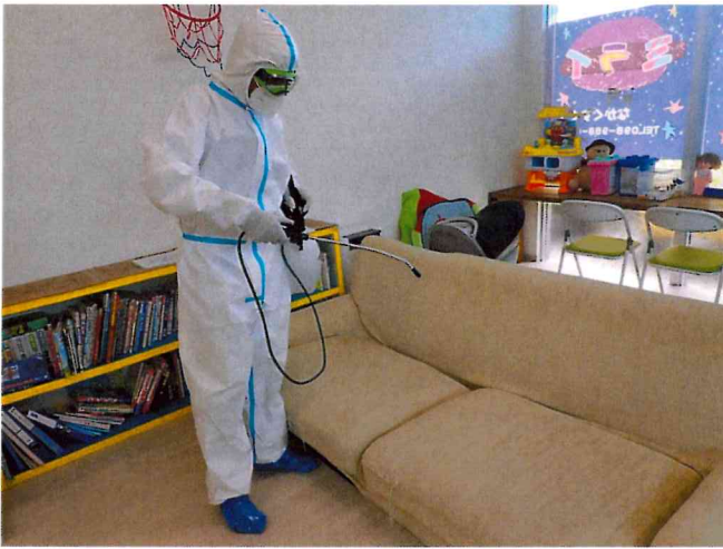
ミライ1, 2 噴霧消毒