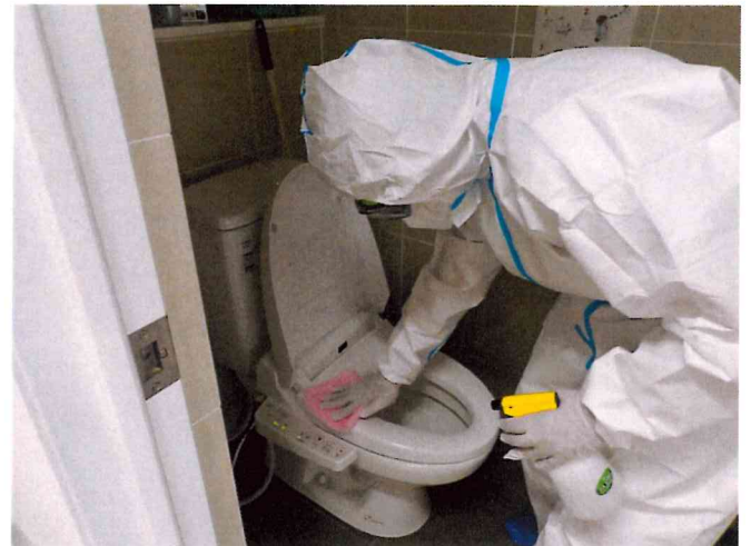
各トイレ 清拭消毒