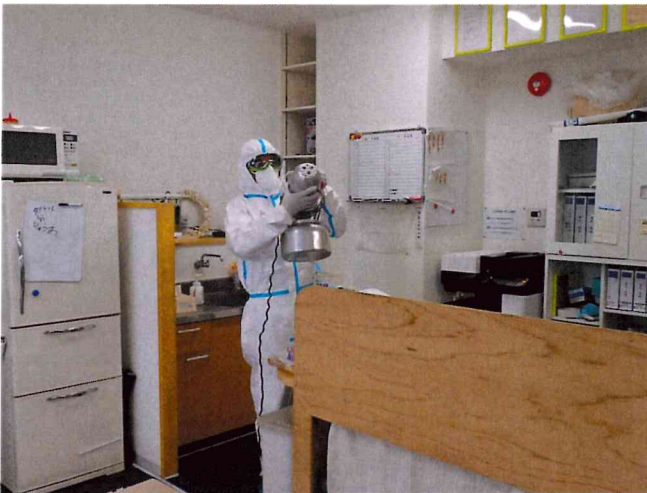
ミライ1, 2 ULV空間除菌