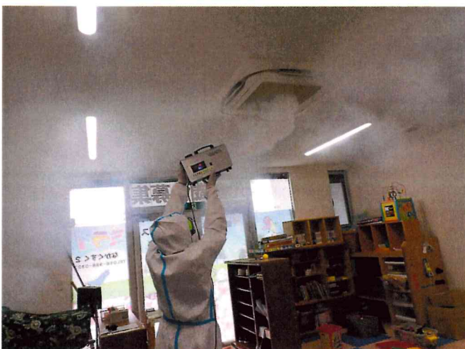
ミライ1, 2 ウルトラシールド煙霧施工