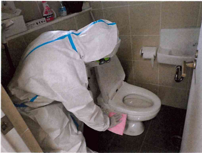
各トイレ 清拭消毒