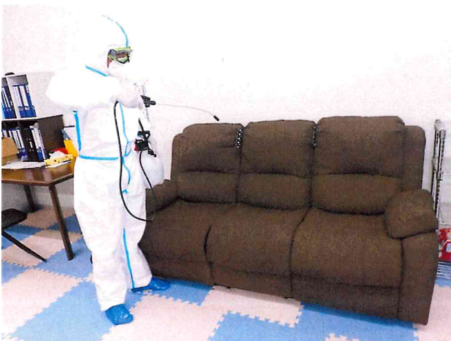
ミライ1, 2 噴霧消毒