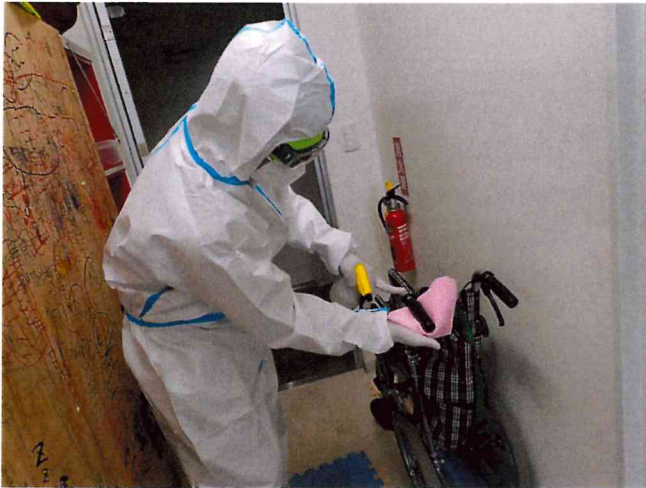
ミライ1, 2 清拭消毒