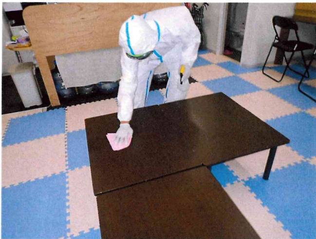
ミライ1, 2 清拭消毒