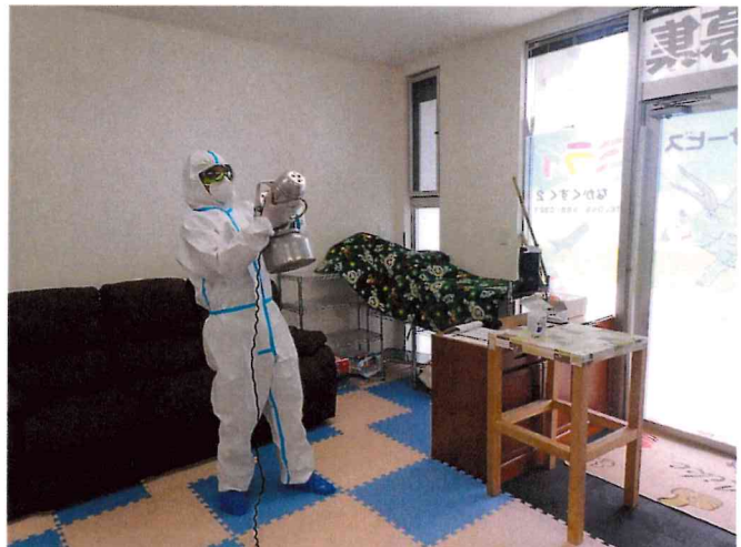
ミライ1, 2 ULV空間除菌